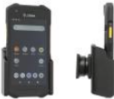
Passive Fahrzeughalterung zur Verschraubung, (Erweiterbar mit RAM Mount oder Saugnapf)