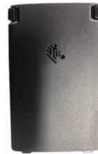
Standardakku (3100 mAh) / High Capacity Akku (5000 mAh)