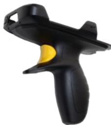
Pistolengriff / Scan Handle