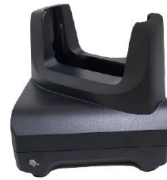
1-fach USB Cradle