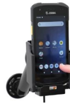
Fahrzeug-Ladestation, 12V/24V über Zigarettenanzünder zur Verschraubung, (Erweiterbar mit RAM Mount oder Saugnapf)