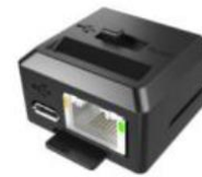
Ethernet Adapter für 1-fach Cradle