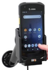
Fahrzeug-Ladestation, 12V/24V für Direktverdrahtung (offene Enden) zur Verschraubung, (Erweiterbar mit RAM Mount oder Saugnapf)

IdentWERK – Mehr als nur Hardware! Als Auto-ID-Systemhaus und Zebra Premier Business Partner unterstützen wir Sie auch bei Service und Support rund um den TC21/TC26, der zentralen Verwaltung Ihrer mobilen Geräte, egal ob im Haus oder im Außendienst und sind Ihr Ansprechpartner für die passende mobile Unternehmensanwendung auf Ihrem Zebra TC21/TC26 - www.identwerk.de