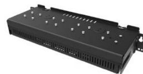
Montagerahmen für Wand- oder Rackmontage für Mehrfach Cradles/Ladestationen