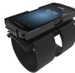
Armhalterung mit Klettverschluß